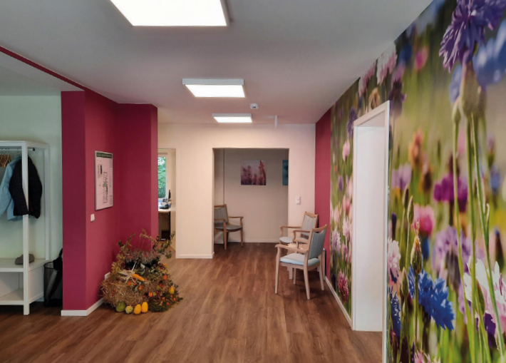
Unsere DRK-Tagespflege in Gudow